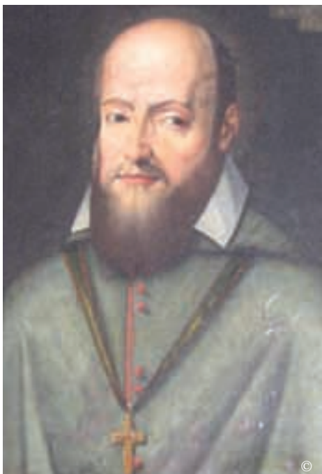
François de Sales, XVII e siècle Visitation d'Annecy

François de Sales, « notre Bienheureux Père » comme nous aimons l'appeler dans nos communautés, a laissé à l'Eglise une doctrine claire, sûre, puisée dans sa vie d'union à Dieu et son expérience de pasteur. Le Christ Jésus est au centre de sa vie et donc de sa spiritualité : l'homme créé à l'image et ressemblance de Dieu. Tout est fait pour l'homme et l'homme est fait pour Dieu, aussi tout homme est aimé, aimable et capable d'amour. Le Verbe fait