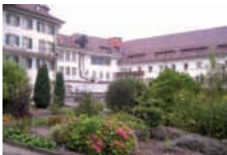
Monastère de la Visitation à Fribourg en Suisse