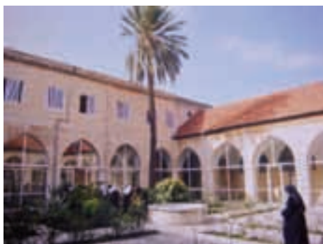
Monastère de la Visitation à Zouk-Mickaël au Liban