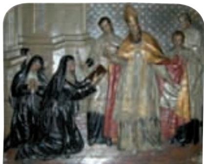
François de Sales et les 3 premières sœurs Bas relief, autel latéral, cathédrale d'Annecy

Le 6 juin 2010, l'Ordre de la Visitation vient de fêter à Annecy le IV ème centenaire de sa Fondation. En effet, le 6 juin 1610, saint François de Sales et sainte Jeanne de Chantal fondaient à Annecy, en Savoie, ce petit Institut de vie évangélique « pour donner à Dieu des filles d'oraison qui soient trouvées dignes de L'adorer en esprit et vérité ».