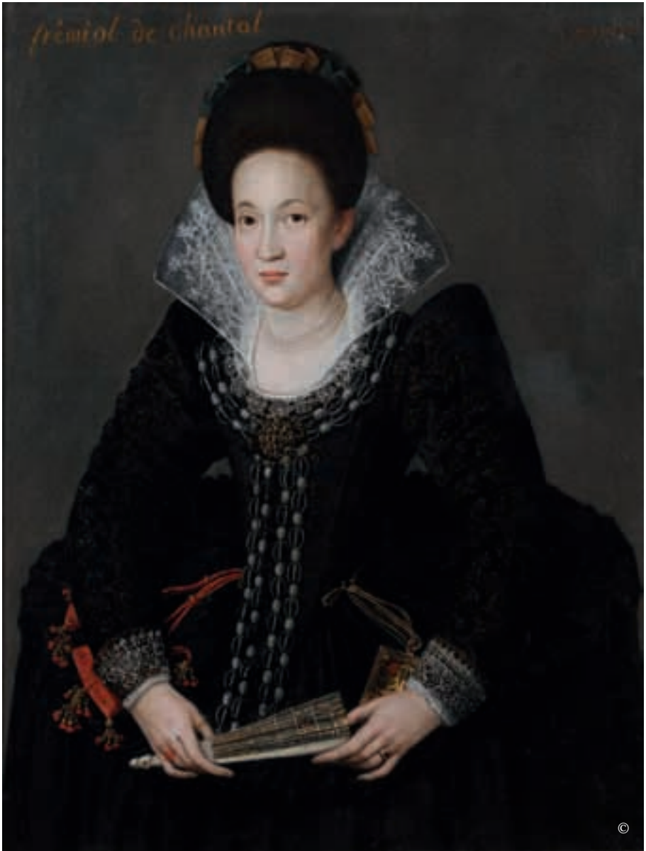
Jeanne de Chantal, Fremyot, 1607