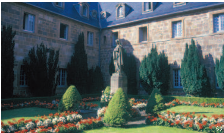
COUVENT DU MONT SAINTE-ODILE (ALSACE)